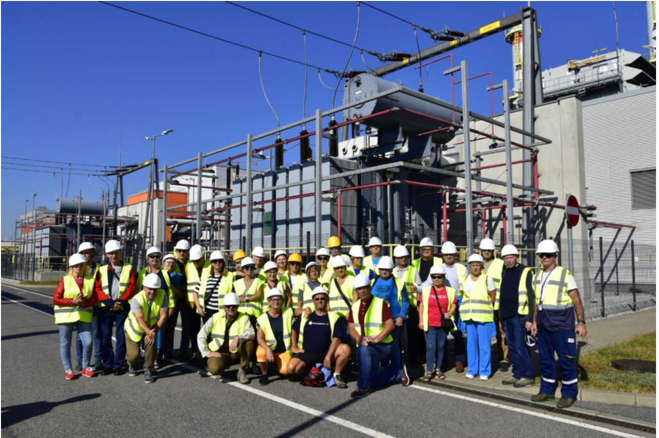
6. Członkowie Koła nr 16 SEP przy KOGENERACJI S.A. na Kaszubach.