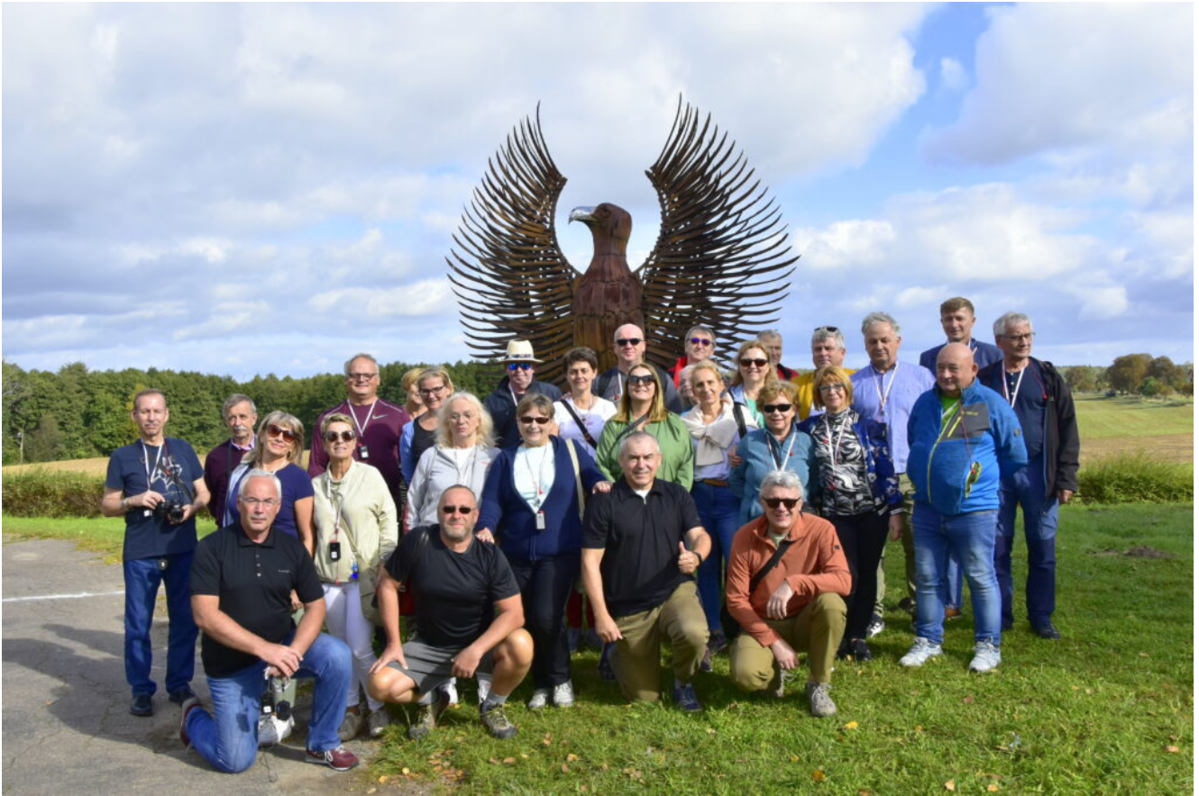
Zarząd Koła nr 16 SEP przy KOGENERACJI S.A.