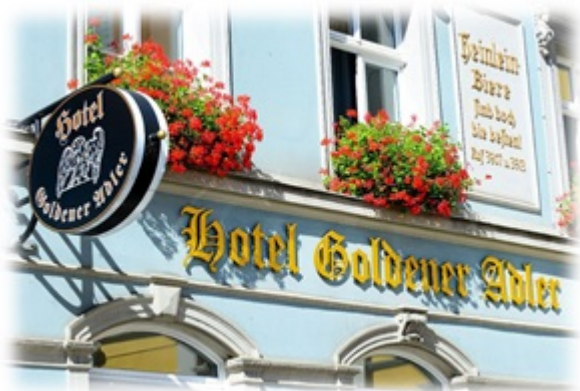
Na zdjęciu po lewej: Elewacja frontowa Hotelu Goldener Adler w Budziszynie.