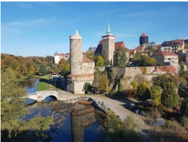
Na zdjęciu z lewej: widok starówki Budziszyna z zamkiem oraz z nową i starą wieżą wodną