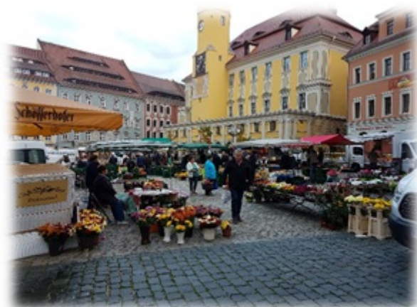
Po prawej: targ kwiatowy na Rynku

W każdą sobotę rano na rynku przed Ratuszem (i przed naszym hotelem) odbywa się wywodzący się ze średniowiecza targ warzywno-kwiatowy. Na targowych stoiskach spotkaliśmy również sprzedających i kupujących z Polski. Wielkość targu oraz ilość osób wystawiających swoje towary jest ograniczona wielkością Rynku. Na pochwałę zasługuje fakt, że tak stara tradycja miejska jak targ warzywny przed Ratuszem jest ciągle kultywowana.